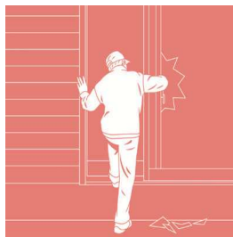
外出・在宅時の防犯