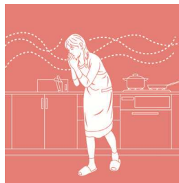
ガス漏れ監視(オプション)

ガス漏れをブザーと音声でご家族に知らせるとともに、異常信号をセコムに送信します。