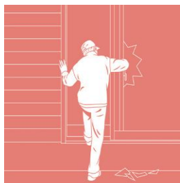
外出・在宅時の防犯