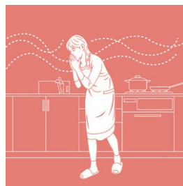
ガス漏れ監視(オプション)

ガス漏れをブザーと音声でご家族に知らせるとともに、異常信号をセコムに送信します。